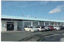
エム・シー通商東北工場

MCTのリサイクルトナーについている排出権は、すべて東北の企業から国内クレジット制度を利用して購入したものです。東日本大震災被災地の排出権付きトナーをご提供しているのは、業界内でも弊社のみ※(2014年1月現在)。東北に工場を持ち、被災もした弊社だからこそ、もっと被災地の役に立ちたい。その思いから生まれた、被災地復興応援もできるリサイクルトナーです。